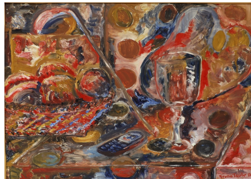
Martwa natura z telefonem, 2006, olej–płótno