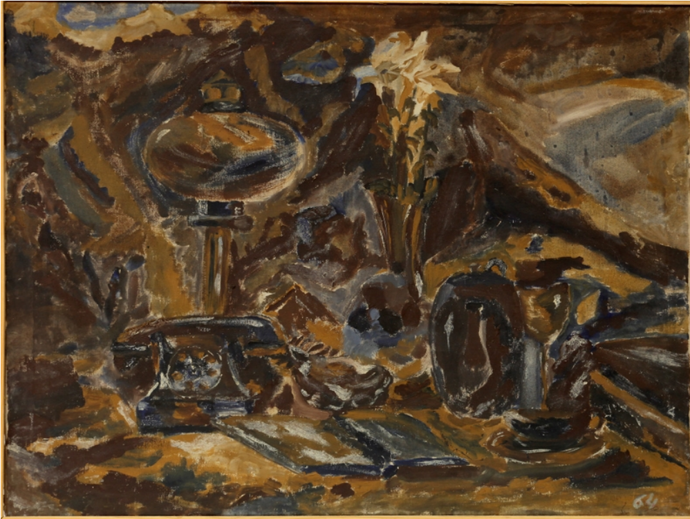
Martwa natura , 1964, olej–plótno