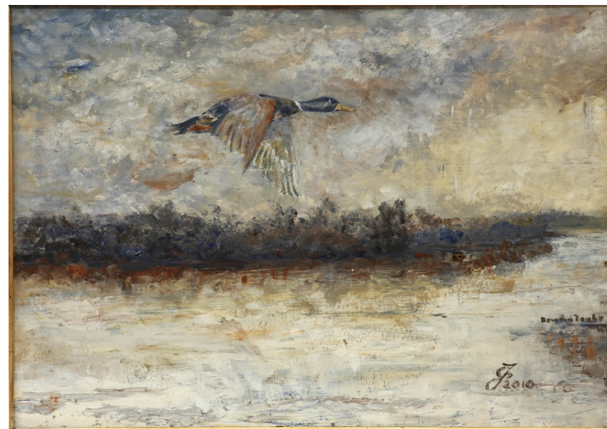
Lot dzikiej kaczki, 2010, olej–sklejka

Artysta był współzałożycielem i pierwszym prezesem działającego od 2000 roku Związku Twórców Ziemi Zawkrzeńskiej, który zrzesza malarzy, rzeźbiarzy, twórców tkaniny artystycznej, fotografików oraz twórców pióra poetów i prozaików.