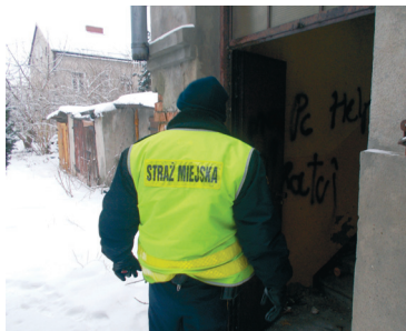
Straż miejska codziennie sprawdza miejsca, w których mogą przebywać osoby bezdomne

Nie bądźmy obojętni, gdy widzimy osoby bezdomne na terenie naszego miasta. Coraz niższe temperatury mogą być dla nich zabójcze. Informujmy odpowiednie służby o miejscu ich przebywania, jeden telefon może uratować czyjeś życie. Już we wrześniu w Urzędzie Miasta Mława odbyło się posiedzenie Miejskiego Zespołu Zarządzania Kryzysowego oraz służb i organizacji społecznych dotyczące sytuacji osób bezdomnych z terenu Mławy oraz przygotowana się do udzielania im pomocy w sezonie zimowym.