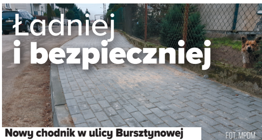
Nowy chodnik w ulicy Bursztynowej