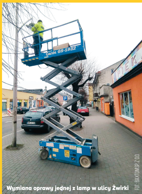
Wymiana oprawy jednej z lamp w ulicy Żwirki

Na ul. Żwirki 23 sodowe oprawy oświetleniowe o mocy 250 W zostały wymienione na oprawy LED o mocy 96 W każda, a 22 sodowe oprawy oświetleniowe o mocy 70 W – na oprawy LED o mocy 48 W każda. Na ul. Targowej 13 sodowych opraw oświetleniowych o mocy 150 W wymieniliśmy na oprawy LED o mocy 60 W każda, a 10 opraw oświetleniowych o mocy 70 W – na oprawy LED o mocy 38 W każda. Z kolei na ul. Handlowej 7 opraw oświetleniowych o mocy 150 W wymieniono na oprawy LED o mocy 60 W każda. W ogłoszonym przez Miasto Mława postępowaniu na wykonanie modernizacji ofertę złożył jeden podmiot – firma Baxtom Sp. z o.o. i to właśnie ona zrealizowała zadanie. Łączny jego koszt wyniósł 122 385 zł.