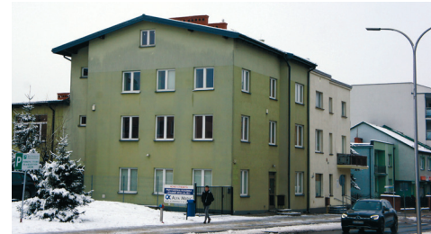
Adaptację budynku wykona mławska spółka TBS