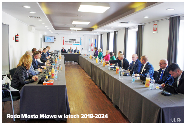
Rada Miasta Mława w latach 2018-2024