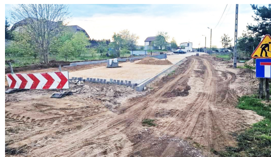
Ulica 20 Dywizji Piechoty Wojska Polskiego jest w trakcie remontu

leńską. Przypomnijmy, że obecnie trwają lub niedługo się rozpoczną prace na ulicach Śliwczynskiego, 20 Dywizji Piechoty Wojska Polskiego, Wesołej, Pięknej, Milej, Hanny Rudzkiej-Cybisowej, Wacława Grabowskiego „Puszczyka”, Krętej oraz Altera. Na remont kolejnych 22 ulic pozyskaliśmy już