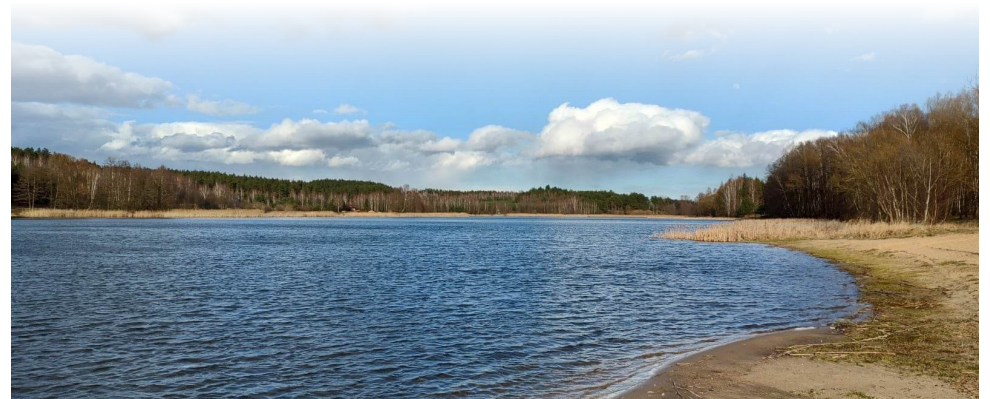
Będzie plaża nad zalewem Ruda

dowskiego – w granicach których zalew jest położony). – W konsekwencji tego podpisanego dokumentu rozpoczną się prace mające na celu wypracowanie koncepcji i rozpoczęcie realizowania etapami naszego wspólnego pomysłu. Do tego pomysłu zachęcamy również mieszkańców. To jest projekt otwarty – podkreśla burmistrz Kowalewski.