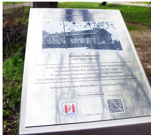
Postument przy ul. Sienkiewicza

Tablice informacyjne z nazwą obiektu w trzech językach – polskim, angielskim i hebrajskim – krótkim opisem oraz kodem QR odsyłającym do obszerniejszego artykułu na stronie internetowej www.mlawa.pl zamontowaliśmy w czterech lokalizacjach: przy ul. Kruczej, gdzie znajdował się najstarszy mławski cmentarz żydowski, zwany przez miejscową ludność kirkutem, a w jego pobliżu – najstarsza w mieście synagoga; na jednym z dwóch bloków u zbiegu ulic Smolarnia i Powstania Warszawskiego – na tym terenie znajdowała się jedna z mławskich szkół powszechnych dla dzieci żydowskich; na budynku przy ul. Warszawskiej 34, gdzie przed II wojną światową mieścił się szpital zakaźny, który w czasie wojny włączono w obręb mławskiego getta;