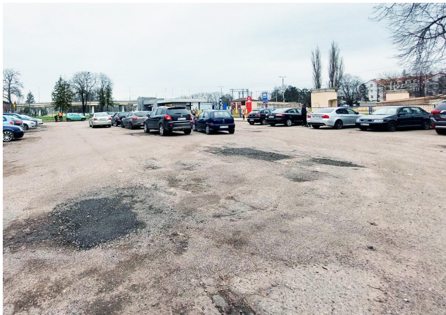
Parking jest w bardzo złym stanie technicznym

Mamy dobrą informację! PKP Polskie Linie Kolejowe S.A. ogłosiły przetarg na budowę nowego parkingu przy dworcu przy ul. Dworcowej. Inwestycja będzie zrealizowana w przyszłym roku.