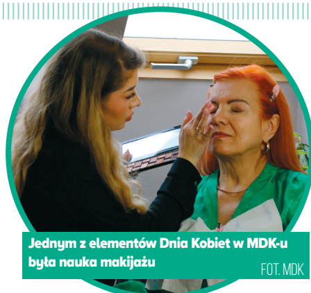
Jednym z elementów Dnia Kobiet w MDK-u była nauka makijażu