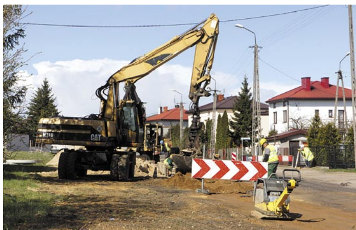
Część środków przeznaczono na inwestycje związane z budową kanalizacji sanitarnej