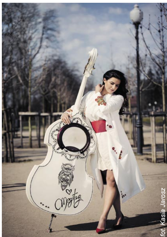
Biały kontrabas – nieodłączny atrybut artystki