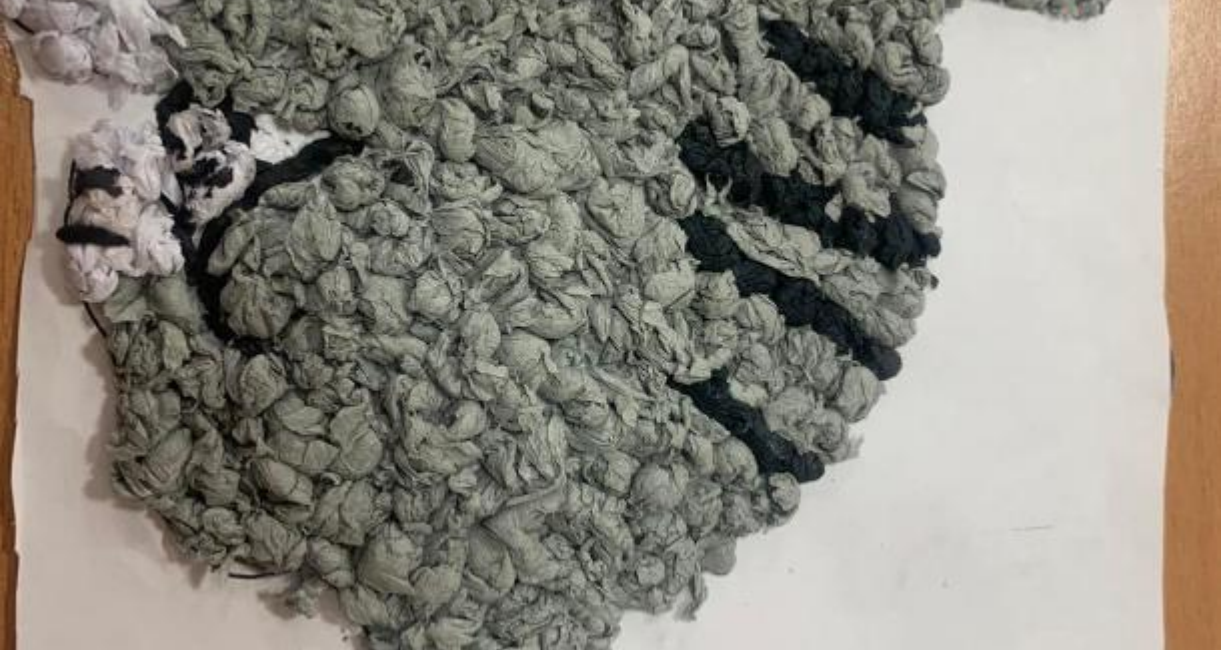
czarny misiek ma okno: