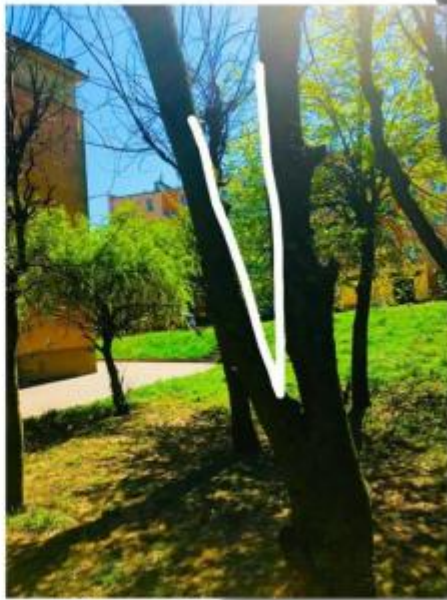
Годка сформована ризез окрєги