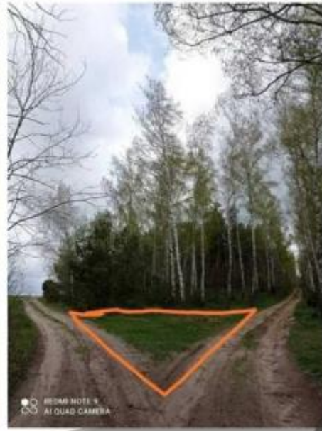
Zero w przyrodzie