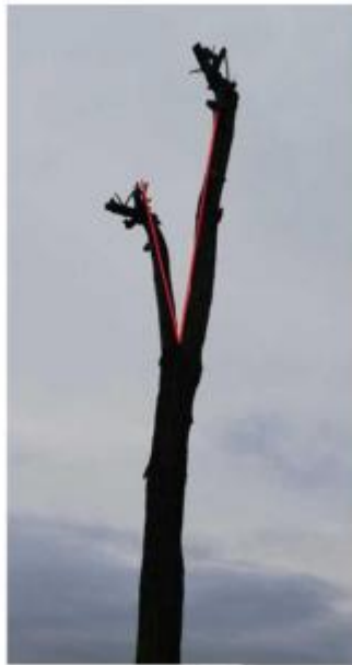
Jedyneczka z trojkątem