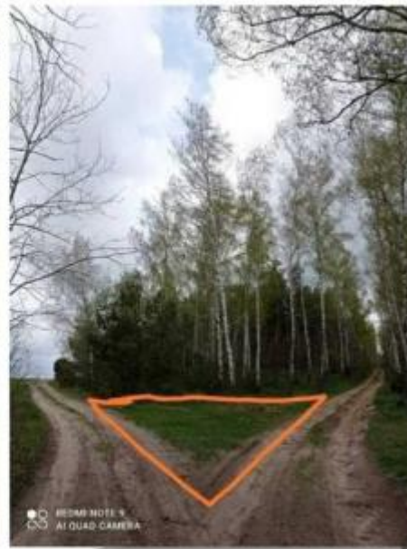
Zero w przyrodzie