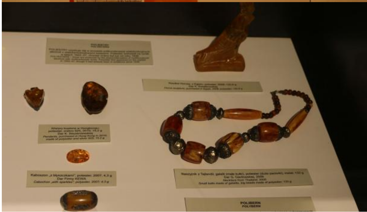
Wisiorek Wisiorek wykonany z żywicy, ok. 1500-1600 r. Wisiorek wykonany z żywicy, ok. 1500-1600 r. Wisiorek wykonany z żywicy, ok. 1500-1600 r.