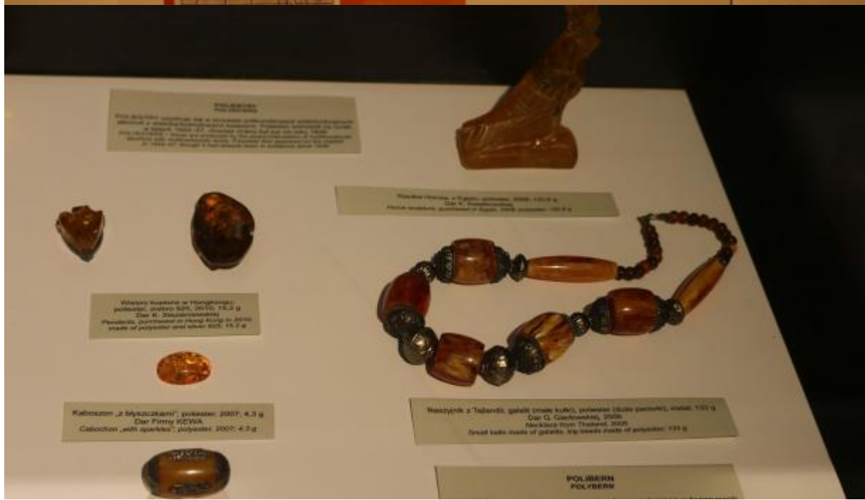
Wieszak Wieszak wykonany z polimeru, 2007, 15,2 g Pendant made of polyester, 2007, 15.2 g