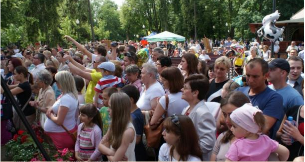
miawa Ogrodu spacerowy.