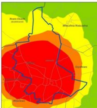
Stężenia B(a)P rok pochodzące z emisji łącznej w Mławie w 2013 r.