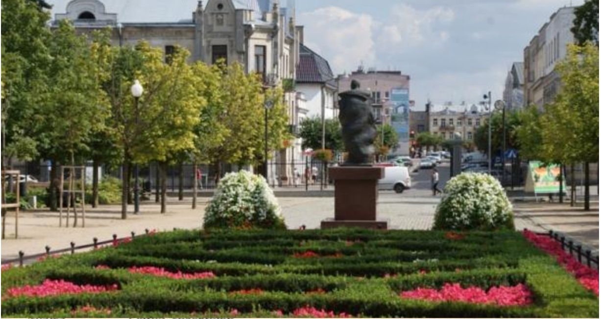
miawa Ogrod spacerowy.