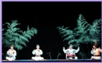
Daegu Muzyka tradycyjna w Korei 대구 국제 예술단