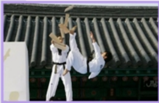
Reprezentacja Narodowa Taekwondo z Korei 대한민국 태권도시범단