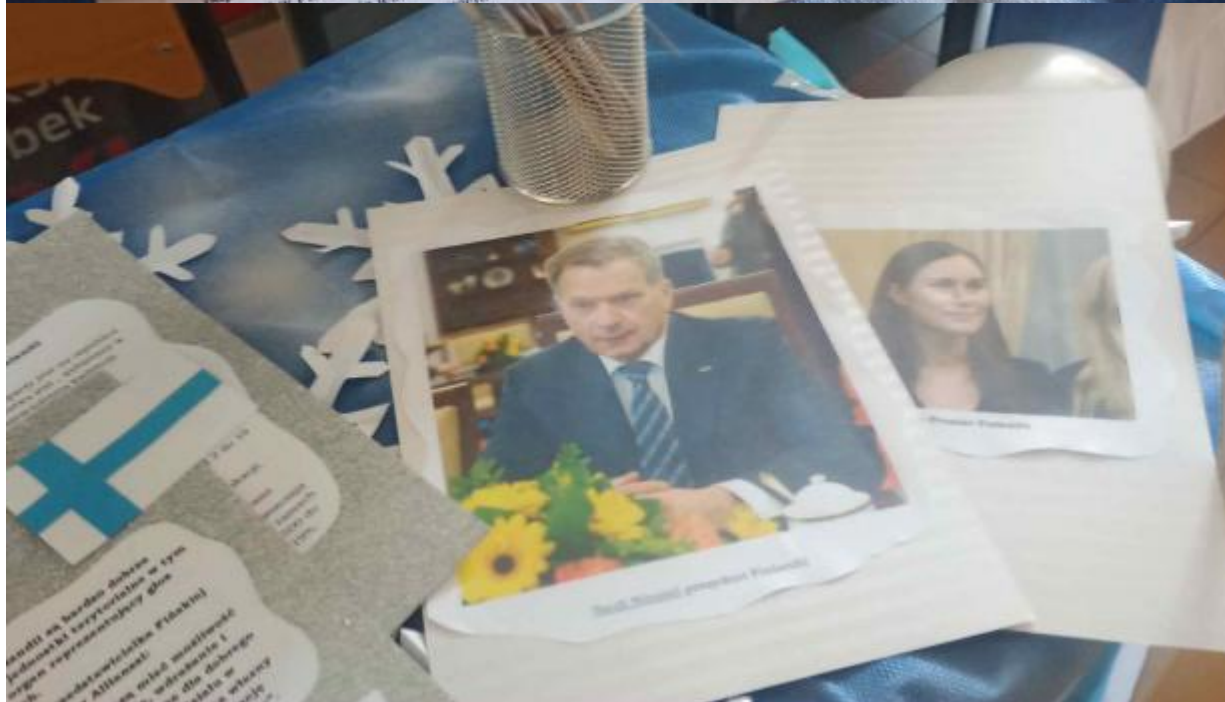
1. M. Mäkelä, ambasador Finlandii w Warszawie